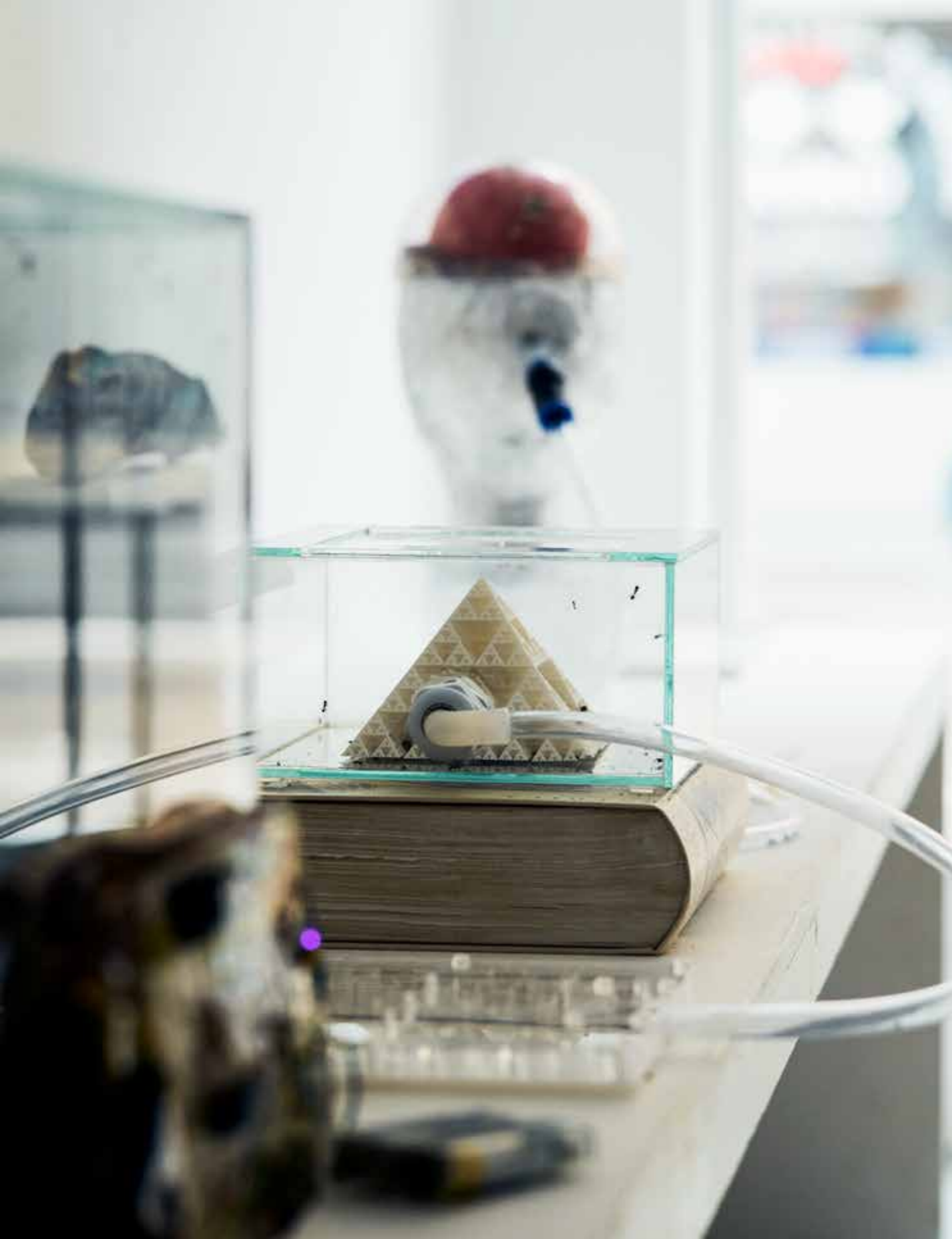
Ausstellungsansicht Labor der Welt